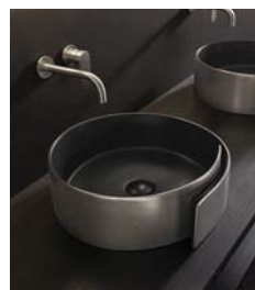
NEW FINISHES SilverBlack/White 12