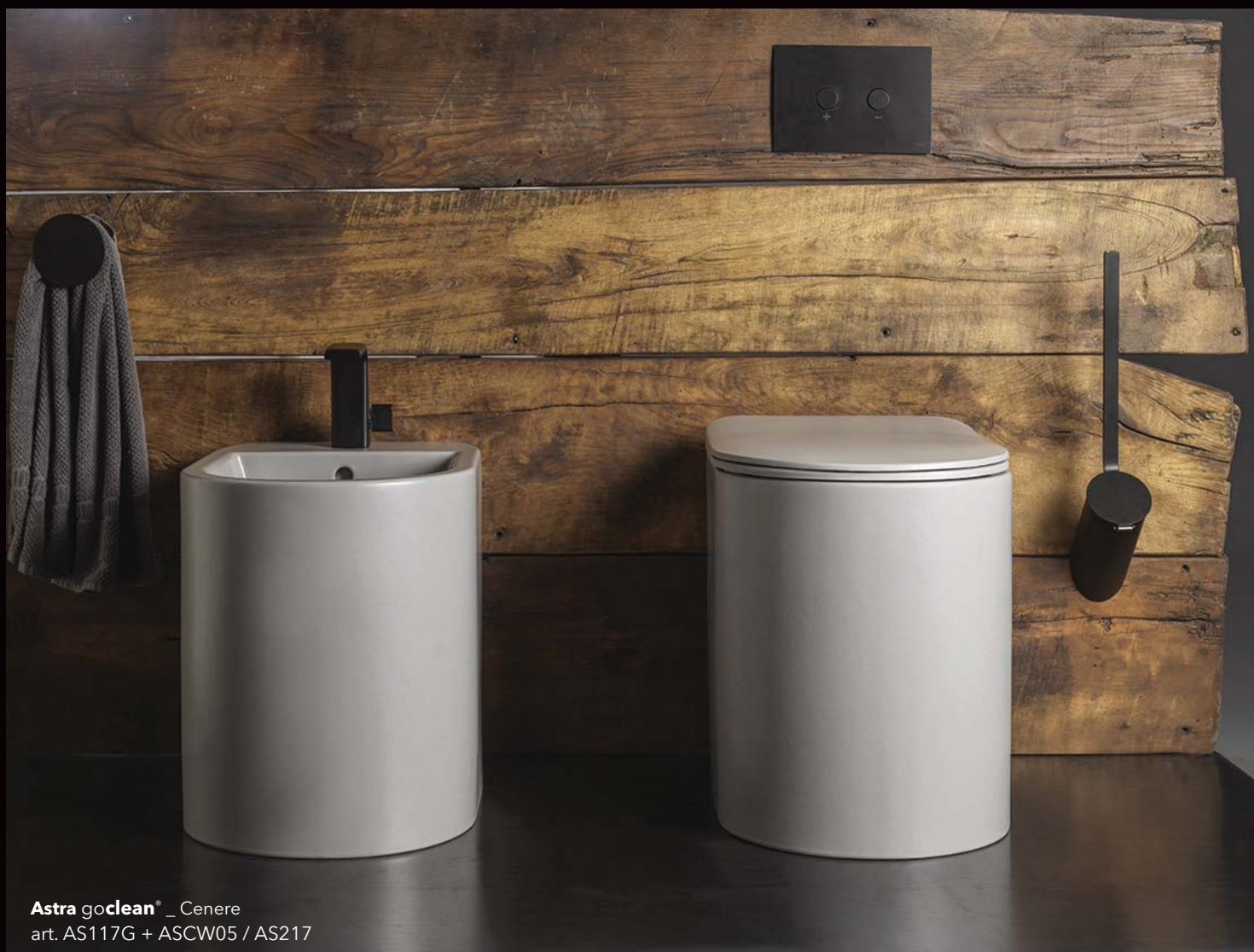
Astrax goclean® _ Cenere art. AS117G + ASCW05 / AS217