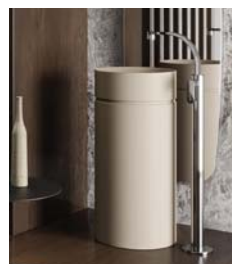
MONOTWIN SLIM 30