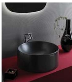
TWINSET SLIM 28