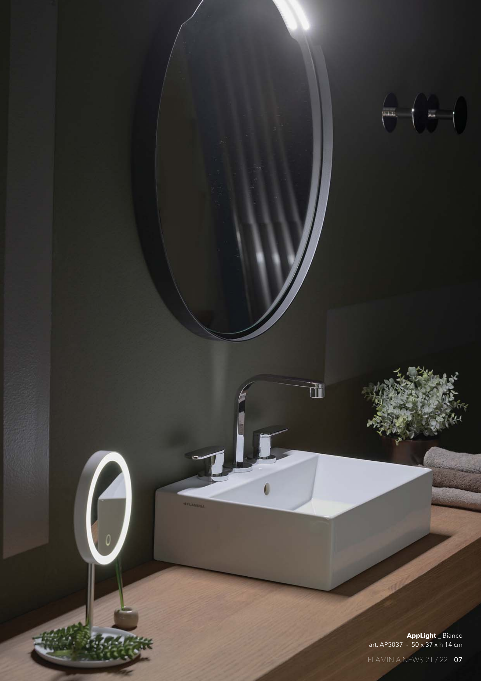
AppLight _ Bianco art. AP5037 - 50 x 37 x h 14 cm