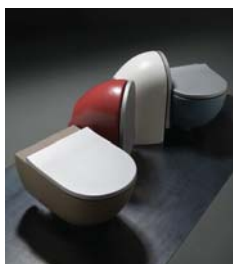
ALLUMINIO cover 10