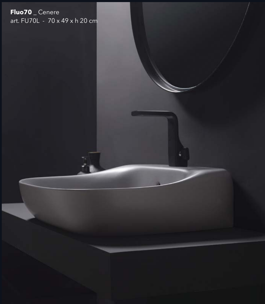
Fluo70 _ Cenere art. FU70L - 70 x 49 x h 20 cm

Flaminia presents the organic lines of the Fluo collection, designed by Niccolò Adolini. Soft surfaces that seem smoothed by water and soft lines without sharp corners bring out the very essence of ceramic. Seamless, light and decisive lines give shape to generous volumes ending in highly refined, slender profiles.