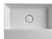
AppLight art. AP5037 50 x 37 x h 14 cm