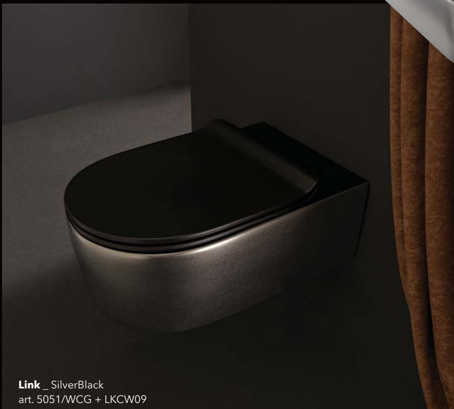
Link _ SilverBlack art. 5051/WCG + LKCW09