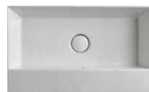
AppLight art. AP6037 60 x 37 x h 14 cm