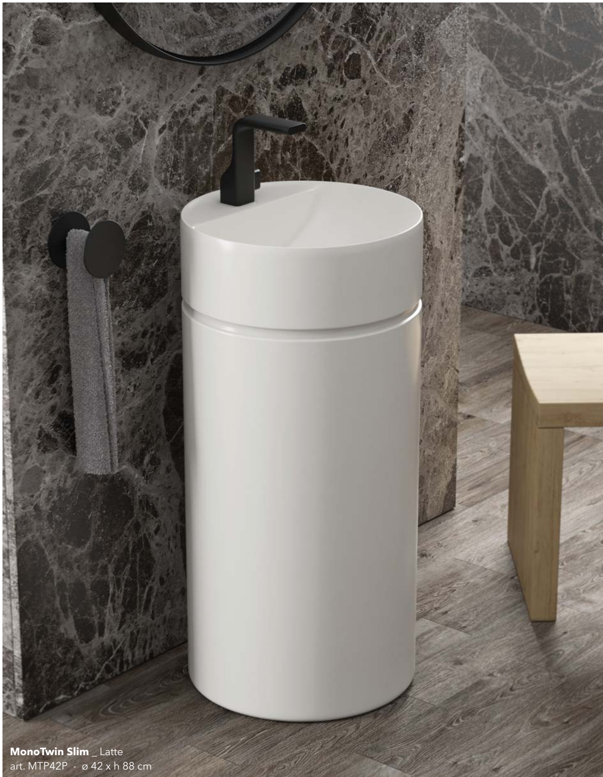
MonoTwin Slim _ Latte art. MTP42P - ø 42 x h 88 cm

In 1998, Ludovica and Roberto Palomba designed TwinColumn, launching a free-standing washbasin solution that did not exist in the market at the time. The product was born of the fusion between a counter-top washbasin and a cylindrical column. 2021 saw the launch of the MonoTwin Slim, heir of the TwinColumn: a one-piece washbasin featuring slender edges that made it look very current.