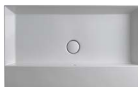
AppLight art. AP8047 80 x 47 x h 14 cm