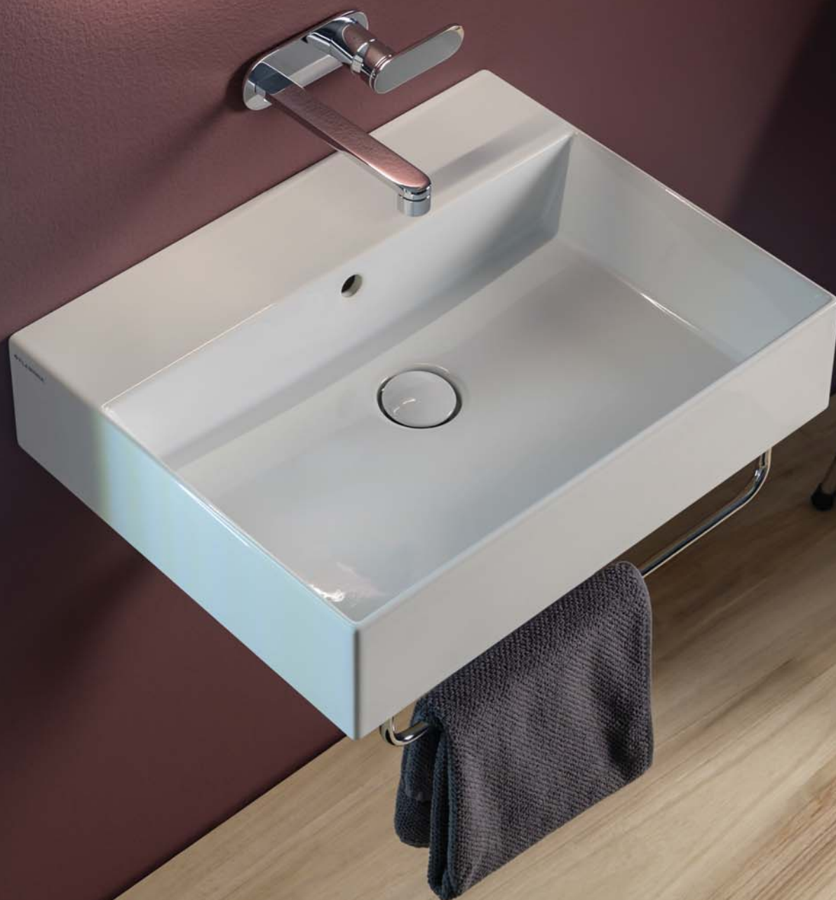
Applight _ Bianco art. AP6047 - 60 x 47 x h 14 cm