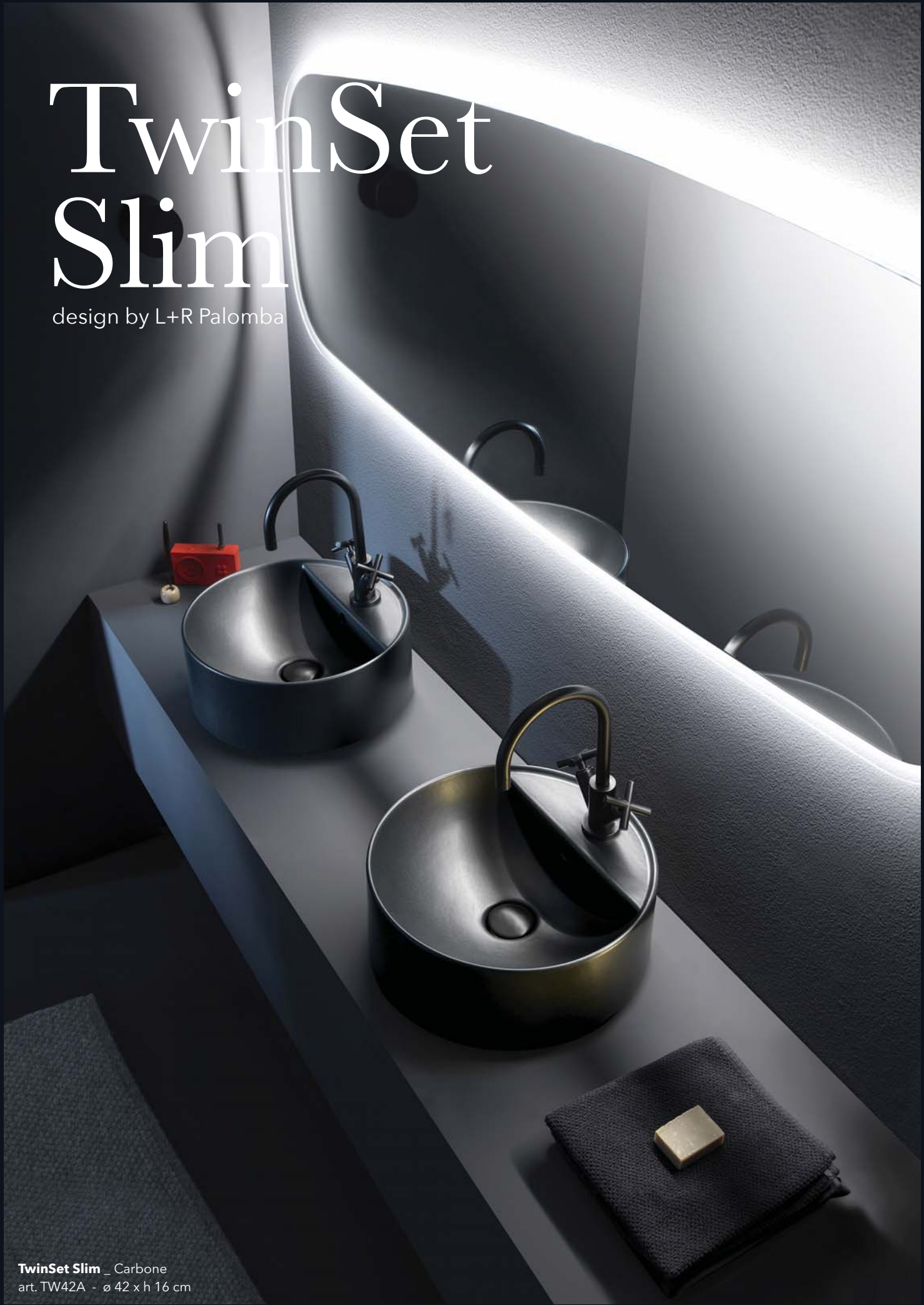
TwinSet Slim _ Carbone art. TW42A - ø 42 x h 16 cm