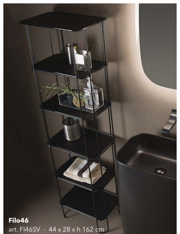
Filo46 art. F146SV - 44 x 28 x h 162 cm