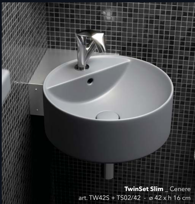
TwinSet Slim _ Cenere art. TW42S + TS02/42 - ø 42 x h 16 cm