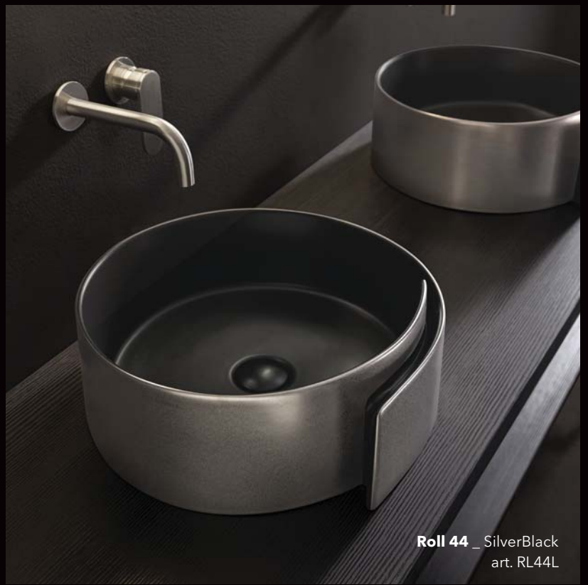
Roll 44 _ SilverBlack art. RL44L