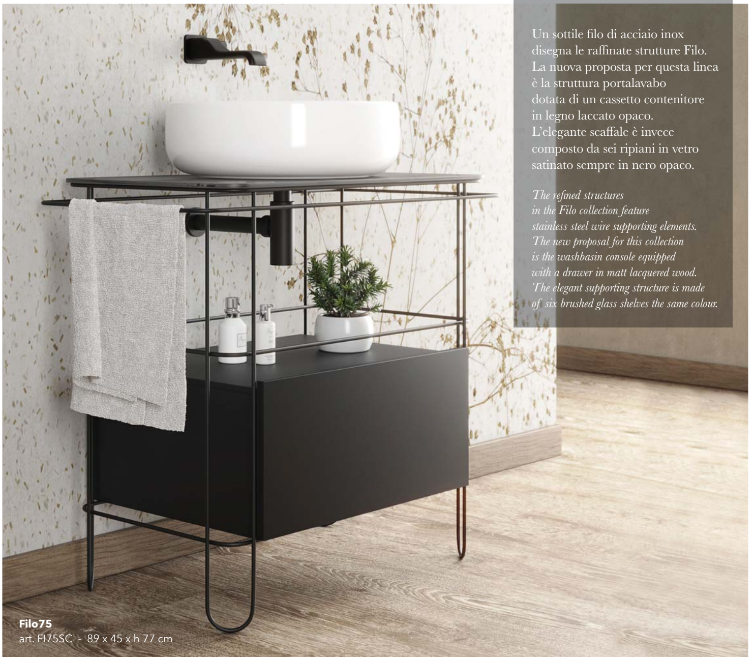
Filo75 art. F175SC - 89 x 45 x h 77 cm

Un sottile filo di acciaio inox disegna le raffinate strutture Filo. La nuova proposta per questa linea è la struttura portalavabo dotata di un cassetto contenitore in legno laccato opaco. L'elegante scaffale è invece composto da sei ripiani in vetro satinato sempre in nero opaco.