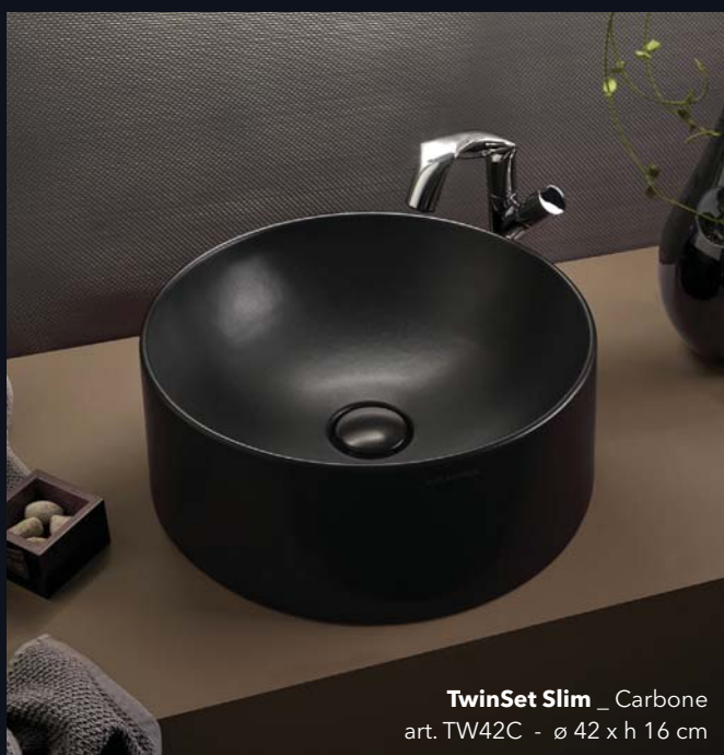
TwinSet Slim _ Carbone art. TW42C - ø 42 x h 16 cm