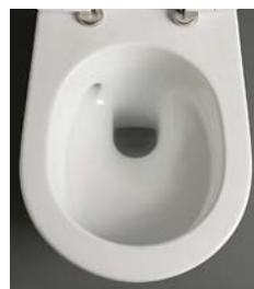
go silent 08