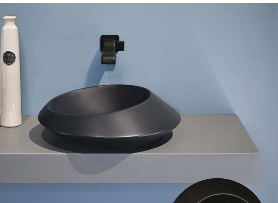
Spire48 _ Carbone art. SP48A - Ø 48 x h 14 cm