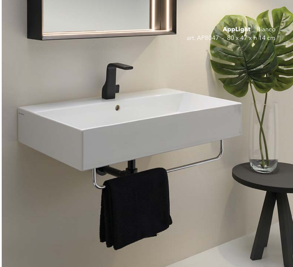
AppLight _ Bianco art. AP8047 - 80 x 47 x h 14 cm