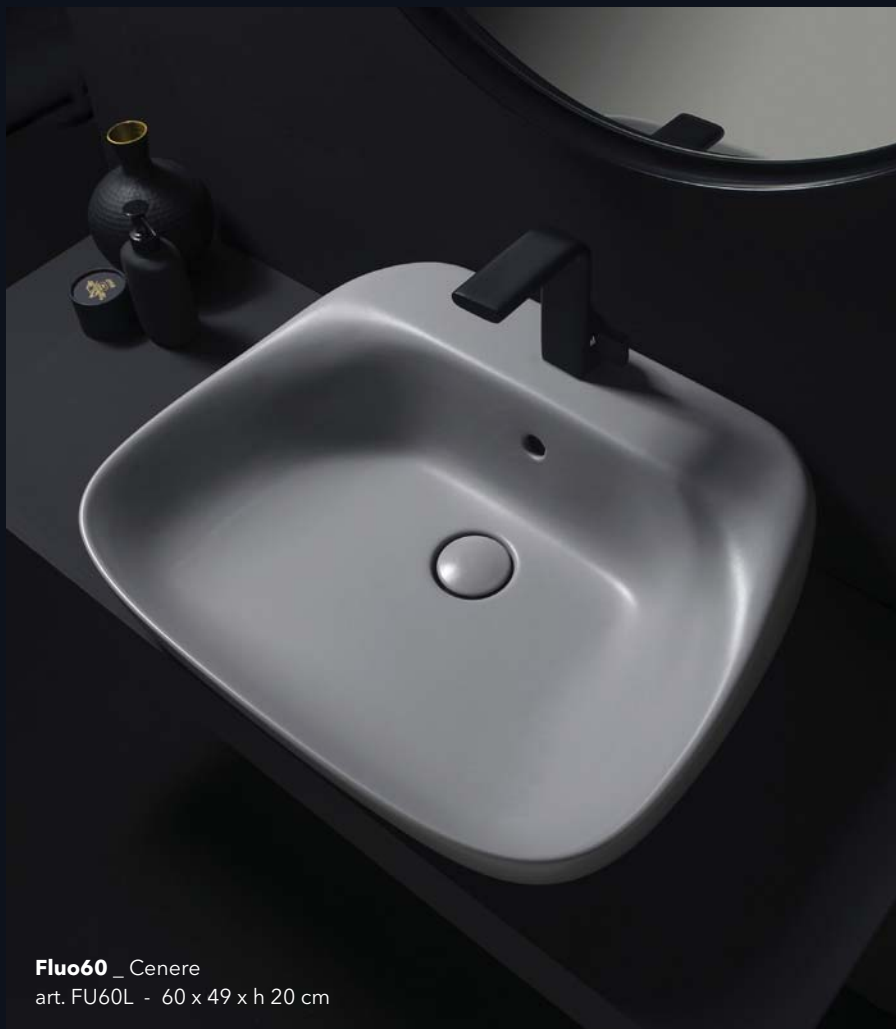
Fluo60 _ Cenere art. FU60L - 60 x 49 x h 20 cm