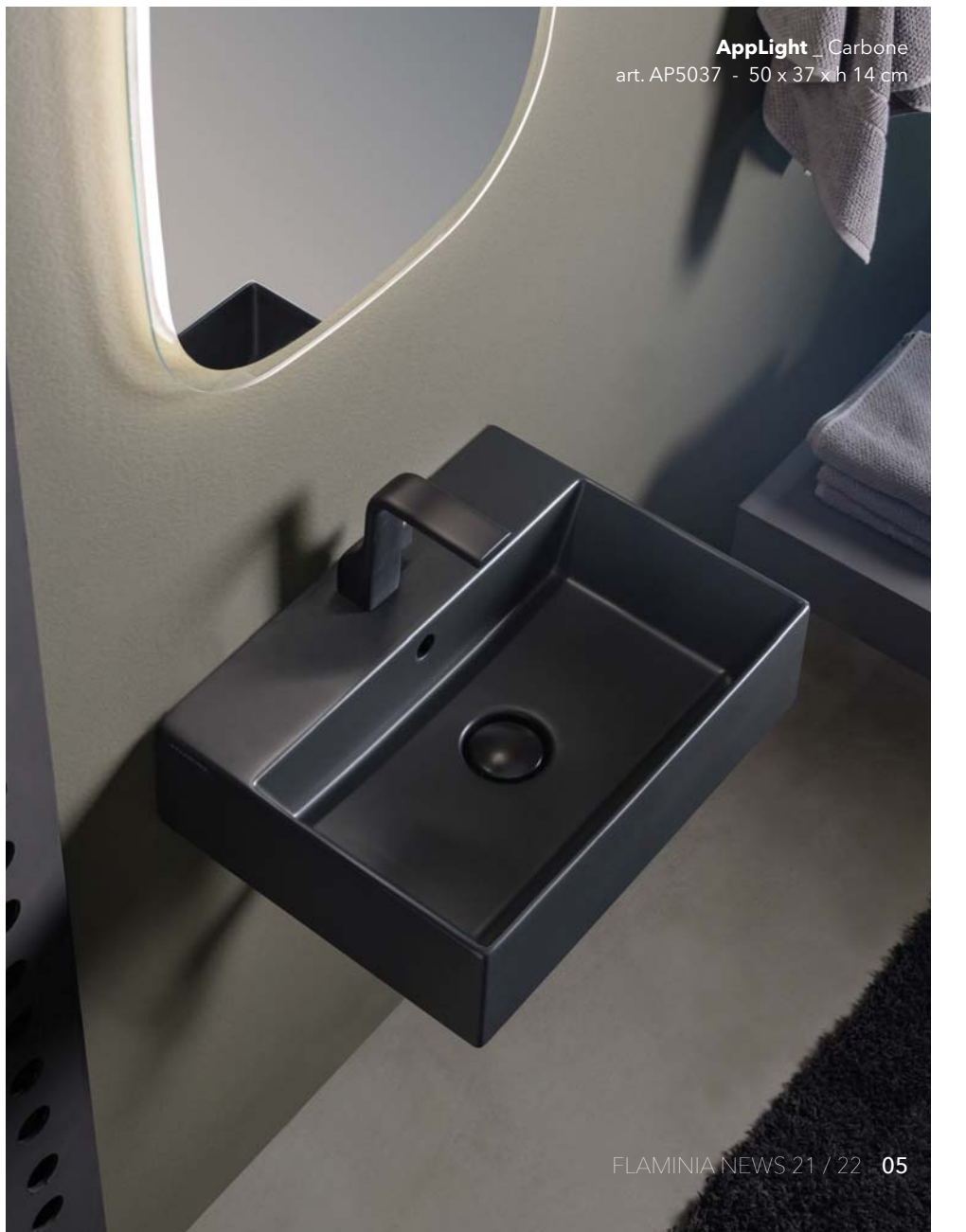
AppLight _ Carbone art. AP5037 - 50 x 37 x h 14 cm