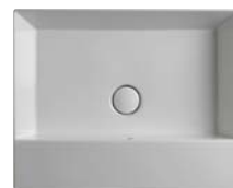
AppLight art. AP6047 60 x 47 x h 14 cm