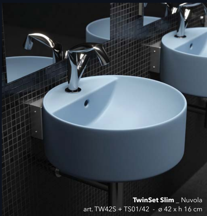
TwinSet Slim _ Nuvola art. TW42S + TS01/42 - ø 42 x h 16 cm