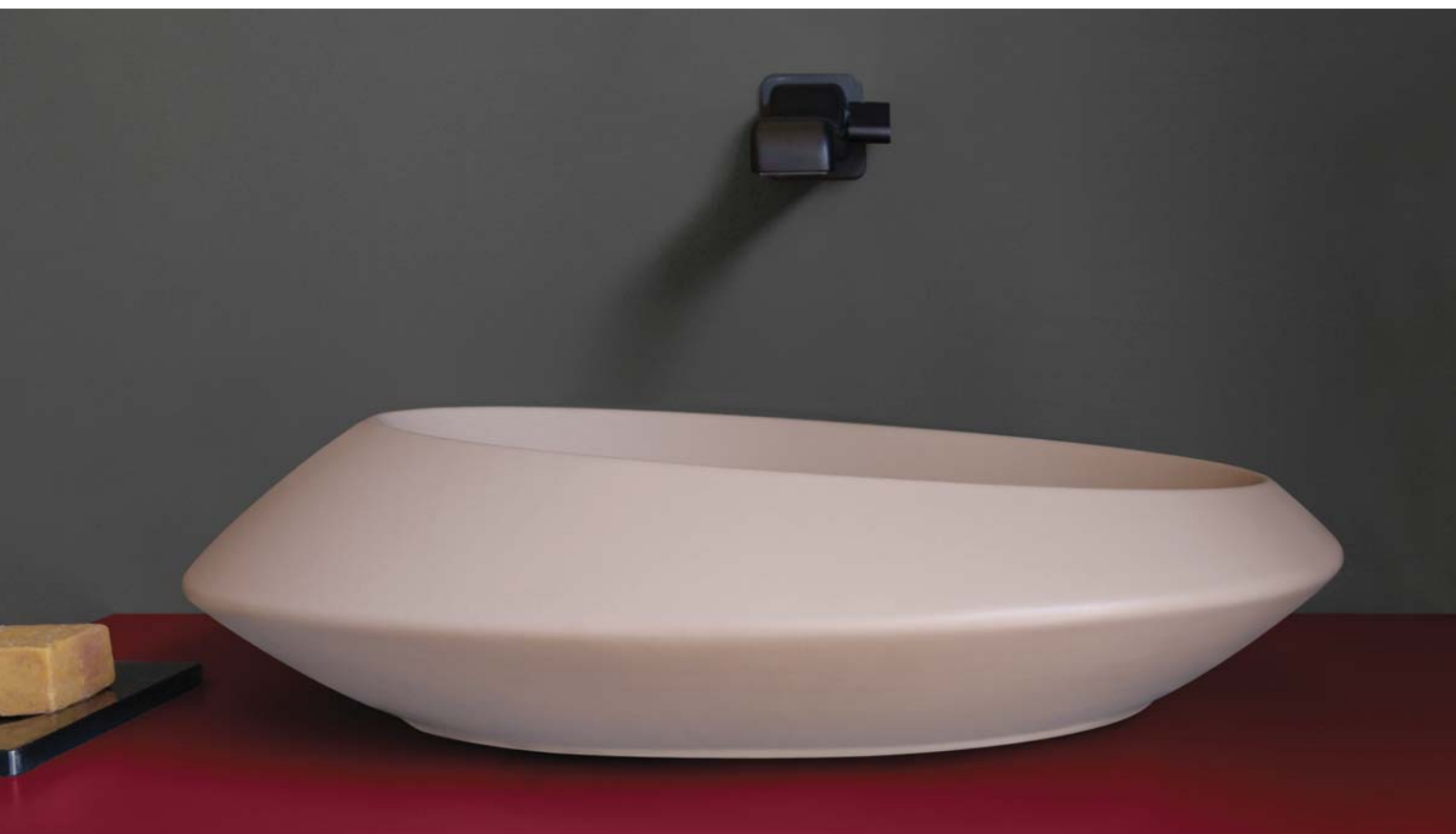
Spire58 _ Argilla art. SP58A - 58 x 46 x h 14 cm