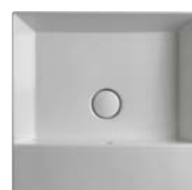
AppLight art. AP5047 50 x 47 x h 14 cm