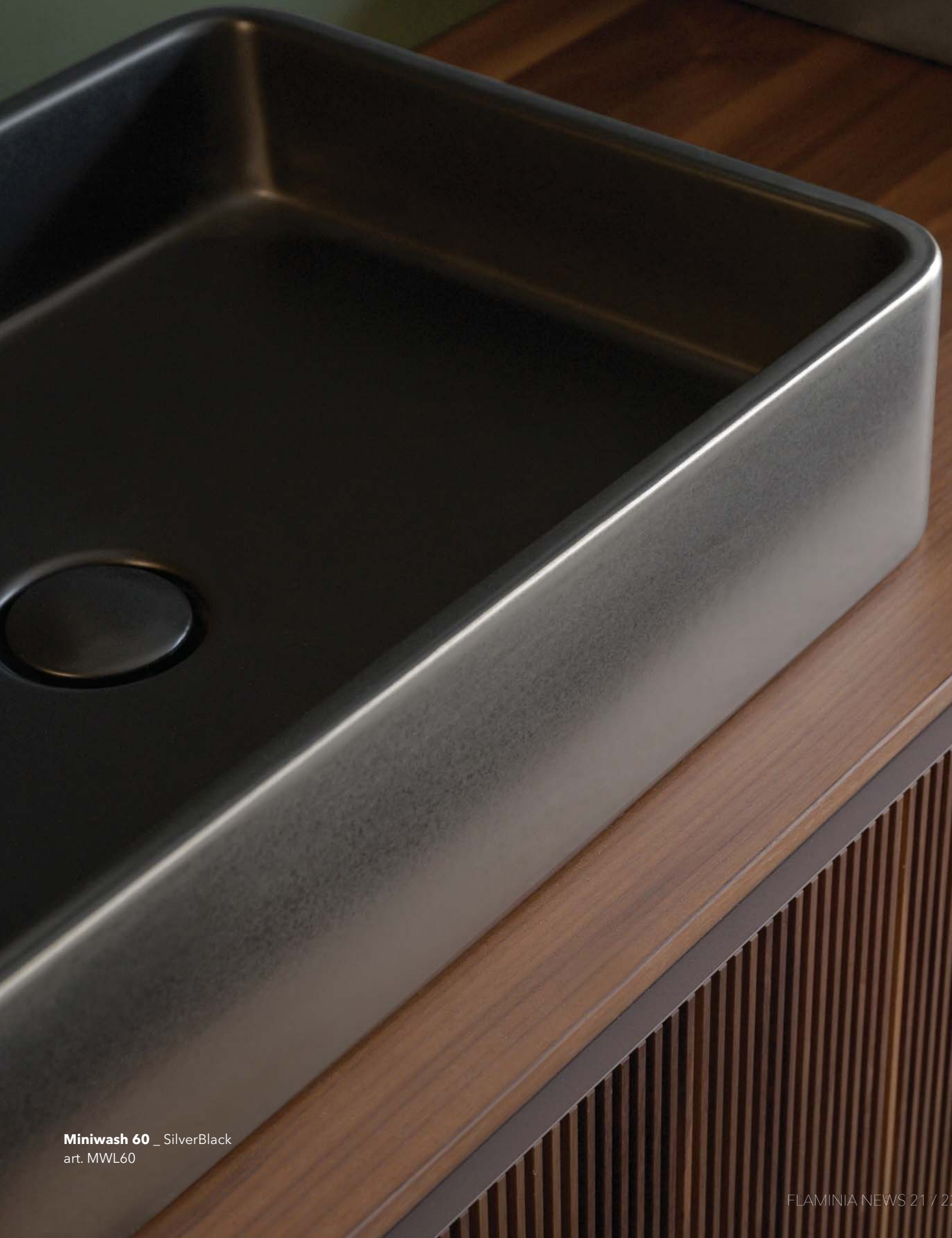
Miniwash 60 _ SilverBlack art. MWL60